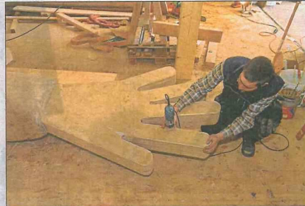
Les concepteurs n'y sont pas allés de main morte: le Pinocchio dépassera les 16 m de haut. Quant au nez, il avoisinera les 4 m.

Le Pinocchio sera alors convoyé, assemblé, puis érigé fin mars sur une colline surplombant le parc d'attractions dédié à